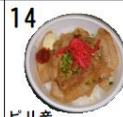
ピリ辛 スタミナ丼