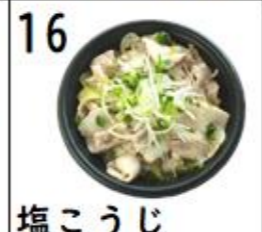
塩こうじ 豚ねぎ丼